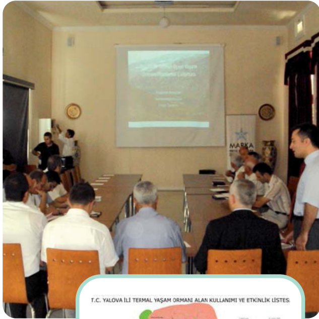
T.C. YALOVA İLİ TERMAL YAŞAM ORMANI ALAN KULLANIMI VE ETKİNLİK LİSTESİ